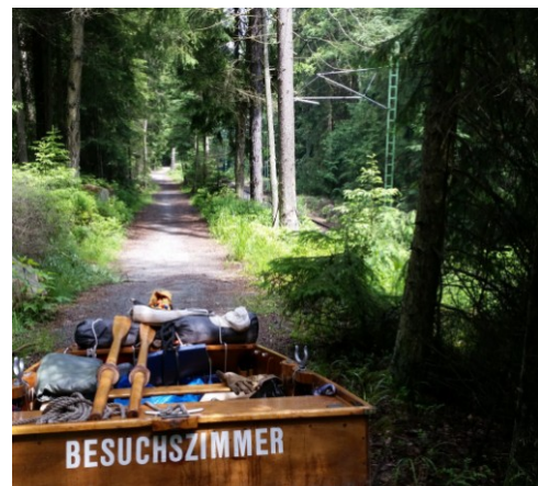
Fig. 7 10 km on a bicycle track from Lake Lipno through the forest to Vyssí Brod was another two days solid ground experience to be told later.

Dank der Tatsache, dass die Details dieser delikaten Affäre von dem Geheimdienstbeamten, Herrn Karl, schließlich akzeptiert wurden, und dank der Interaktion einer russischen Blondin (Fotohintergrund!) konnte unser Generaldirektor heute wieder auf freien Fuß kommen und seine Mission fortsetzen.