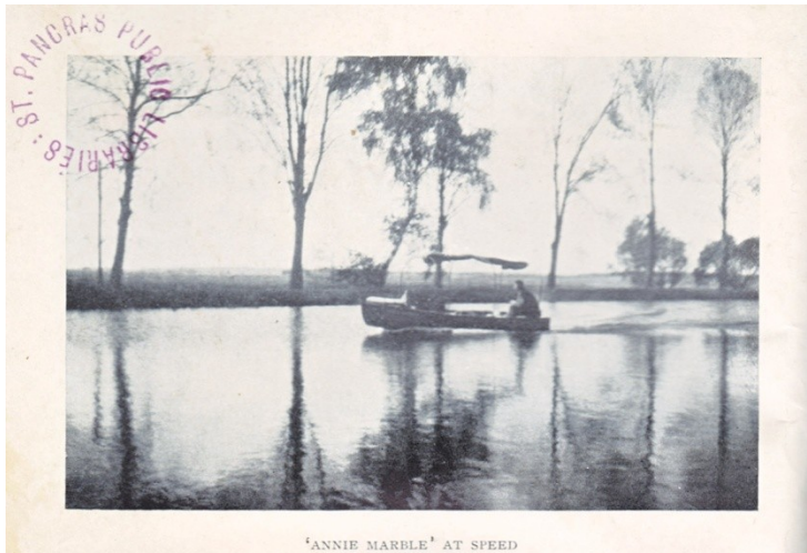
Fig. 2 C.S.Forester on board of Annie Marble in Germany

Ich hatte ja den kürzesten Landweg von der Donau zur Moldau (Lipno-See) geplant, das sind etwa 45 Kilometer, ein kurzes Stück durch Österreich: von Oberzell (letzter Ort in Deutschland, mit kleiner Hafen-Infrastruktur. 300 m über NN) nach Aigen (Österreich. 600m über NN), und von dort nach dem letzten Anstieg (840m über NN) zur Grenze und dann 3km abwärts zum Lipno-See (760m über NN) in der Tschechi.