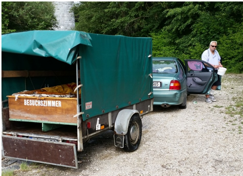
Fig. 4 Beginning of the ride through hell.

Nimm das, was dir entgegen kommt, lasse dich los, packe das Abenteuer.