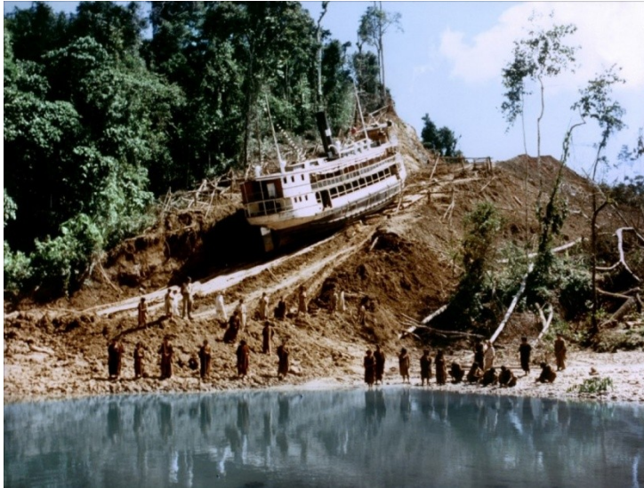
Fig. 1 A shot from Werner Herzog's Fitzcarraldo

Vielleicht kennt ja jemand den Film Fitzcarraldo von Werner Herzog. Ganz kurz: Fitzcarraldo will auf einem brasilianischen Fluss aufwärts fahren, um weit oben mit dem Schiff einen Bergrücken zu überqueren und in einen anderen Fluss zu gelangen, an dessen Flussmündung er dann ein Opernhaus