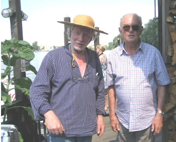
Fig. 6 Baffled Secret Service officer sees off D.E.M.O.I.R.E. CEO at Dolni Vltavice, Lake Lipno. First medical inspections show our CEO in relaxed and healthy condition. Photo by our correspondent through a camera hidden in his life vest

Bildunterschrift: "Verblüffter Geheimdienstbeamter verabschiedet den D.E.M.O.I.R.E.-Generaldirektor bei Dolni Vltavice, Lipno-See. Erste medizinische Untersuchungen zeigen, dass unser Generaldirektor entspannt und bei guter Gesundheit ist" (Foto von unserem Korrespondenten, aufgenommen mit in Schwimmweste versteckter Kamera).